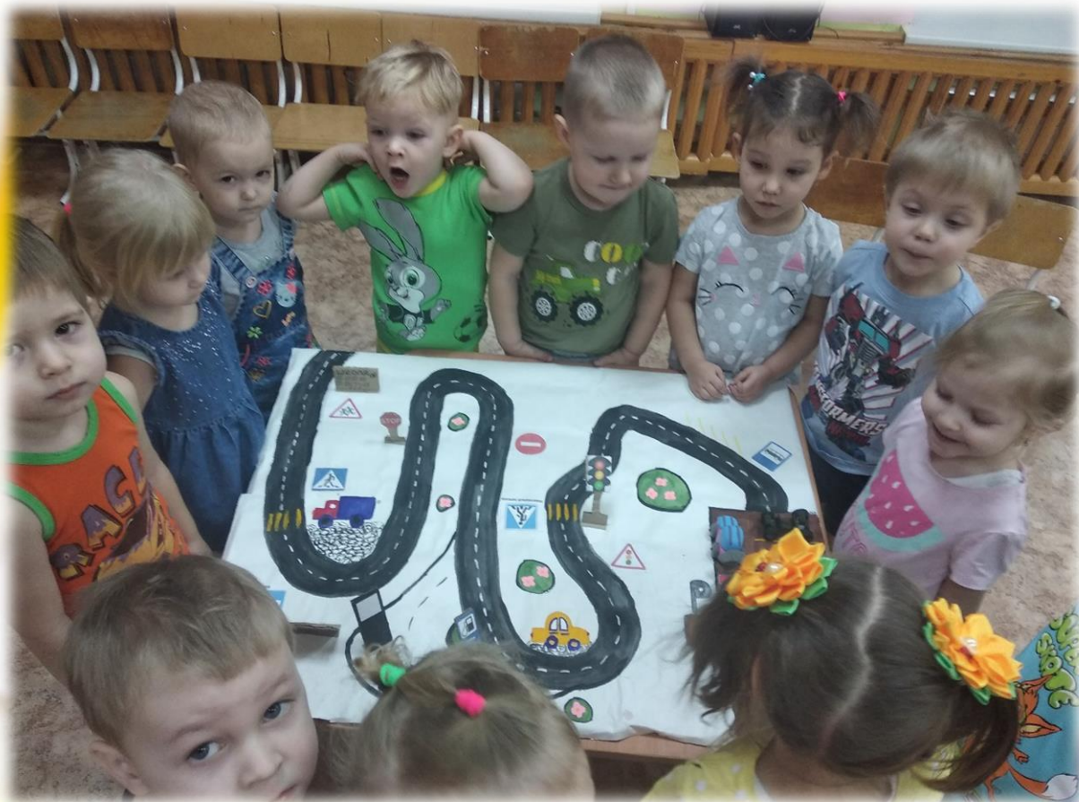
Технология «Скрайбинг» в познавательном развитии