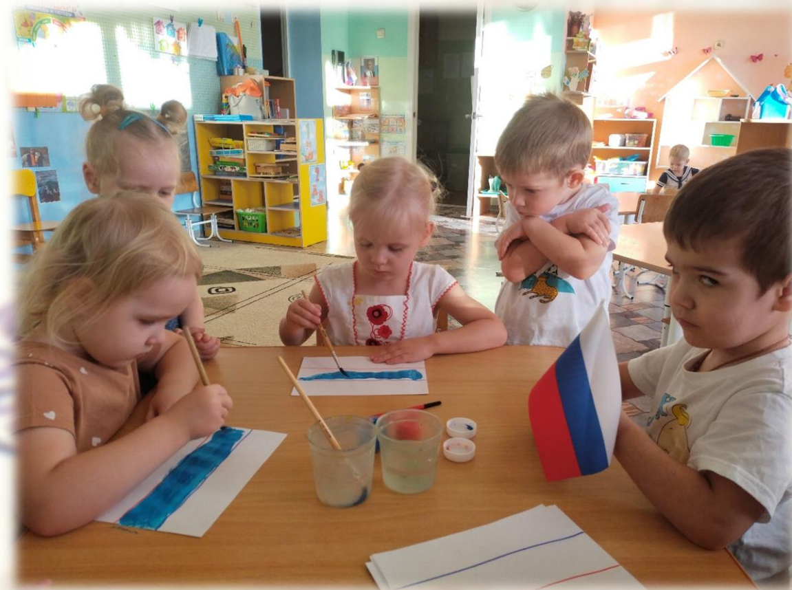
Технология «Скрайбинг» в изобразительной деятельности